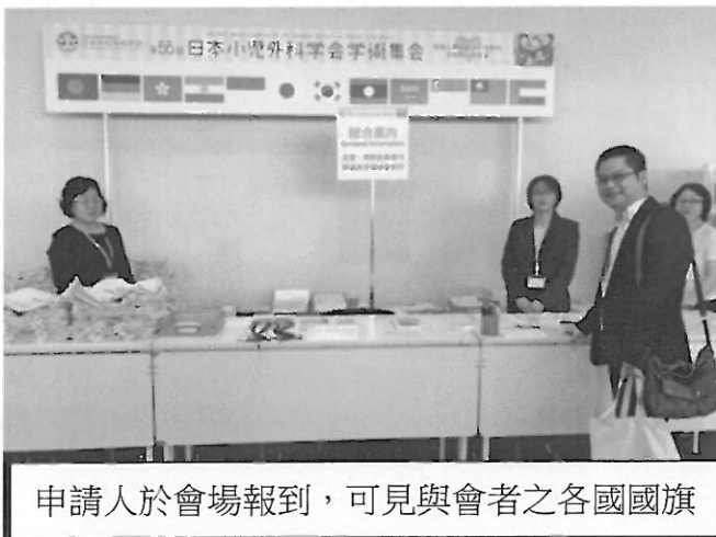
申請人於會場報到，可見與會者之各國國旗