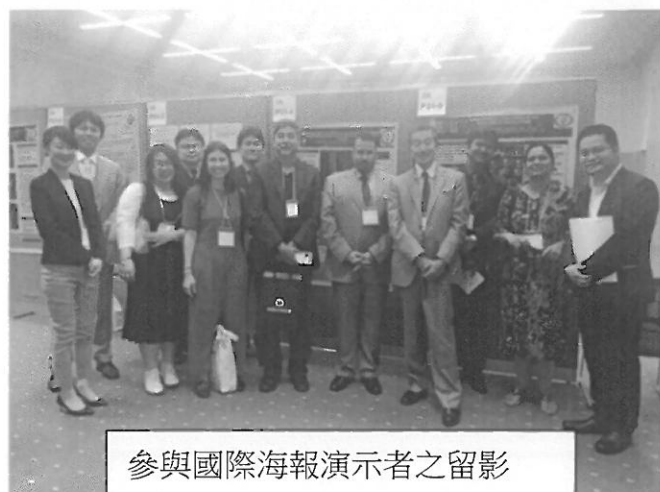
參與國際海報演示者之留影