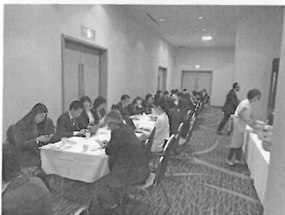
大會準備茶水點心