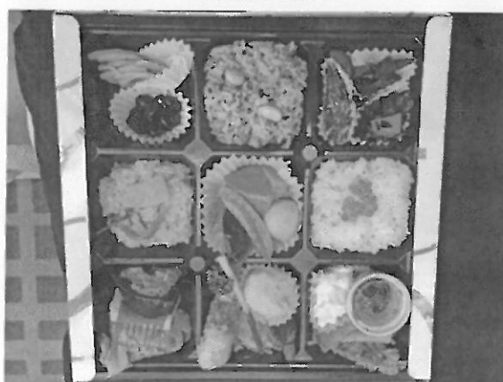
大會提供豐富的便當