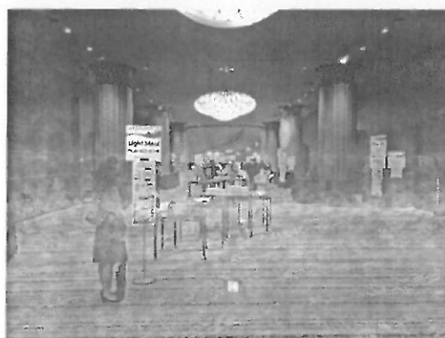
現場準備茶水及點心