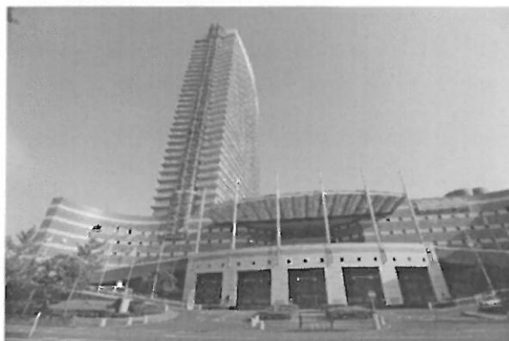
大會會場希爾頓飯店