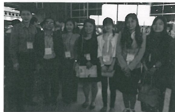
與來自緬甸的醫師們合影留念