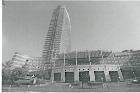
大會會場希爾頓飯店