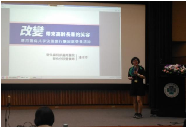
營養品質促進專案 口頭發表