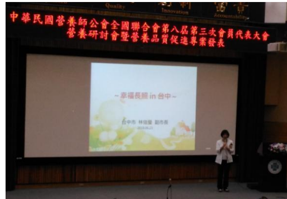
林依瑩 副市長 演講