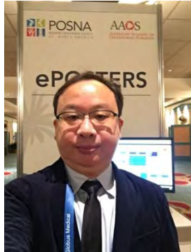
圖一：會場中與海報合影