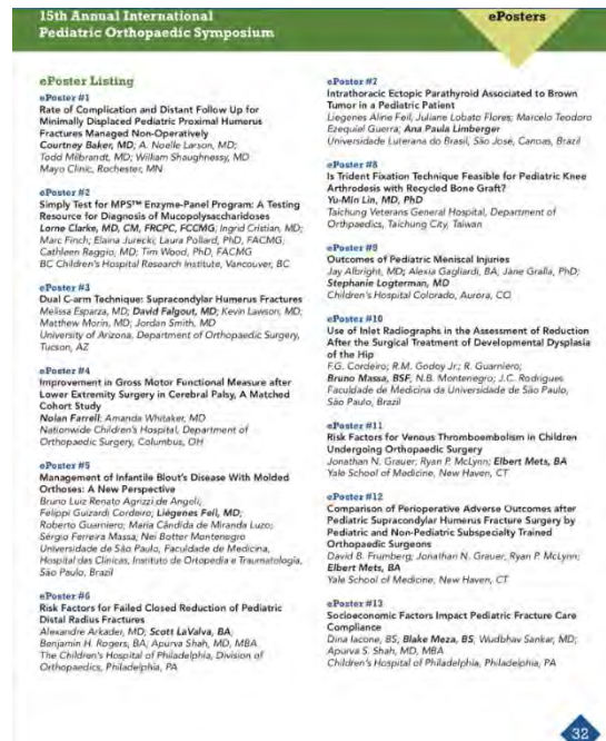
圖二：於大會節目單上 ePoster #8