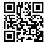
院外報名 QR code

協辦單位： 中華民國醫師公會全國聯合會、臺北市醫師公會、新北市醫師公會、台灣法學會、台灣刑事法學會、高雄大學生醫科技及人工智慧法制研究中心、東海大學法律學院醫事法律研究中心、輔仁大學刑事法學研究中心、東吳大學刑事法研究中心、東吳大學醫事法研究中心、臺灣醫事法律學會、臺灣醫事法學會、台灣醫療衛生研究協會、臺中市醫事法學會、財團法人艋舺清水巖祖師廟、財團法人中華民國德國學術交流協會、財團法人毒藥物防治發展基金會、社團法人臺灣國際醫學聯盟、遠東聯合法律事務所、臺北榮民總醫院社會工作室、臺北榮民總醫院教