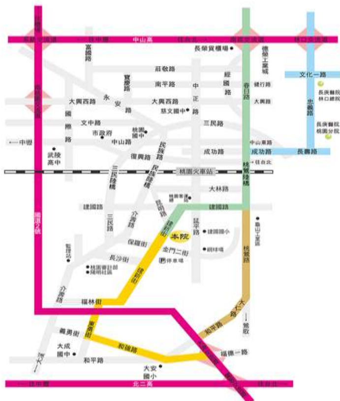
林口、南崁、南桃園、大湳交流道路線圖