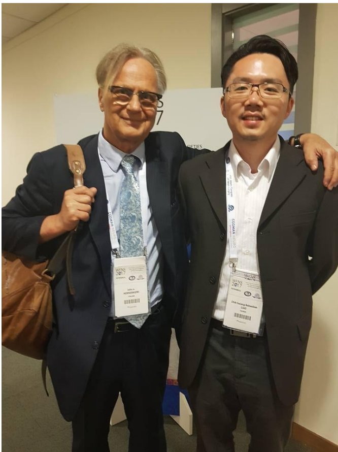
土耳其 伊斯坦堡會議中心