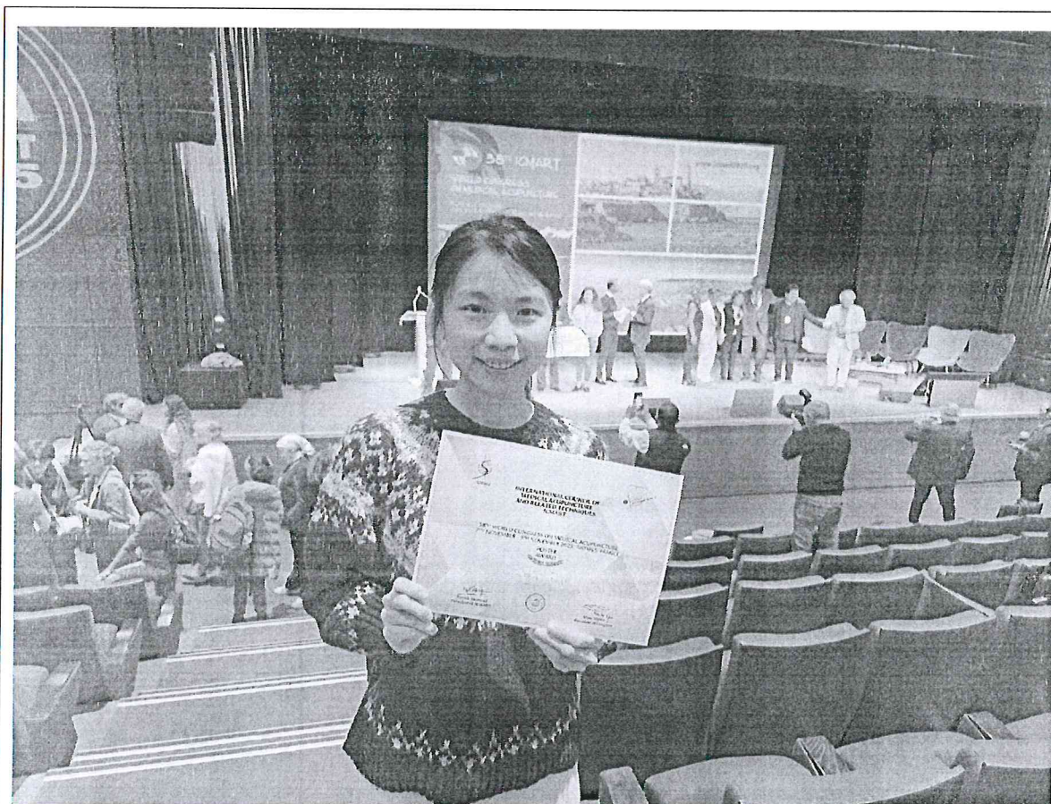
獲頒 poster award