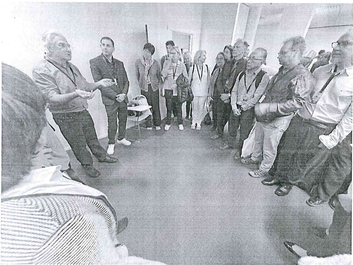
參與烏拉圭團隊的工作坊（腕踝針）