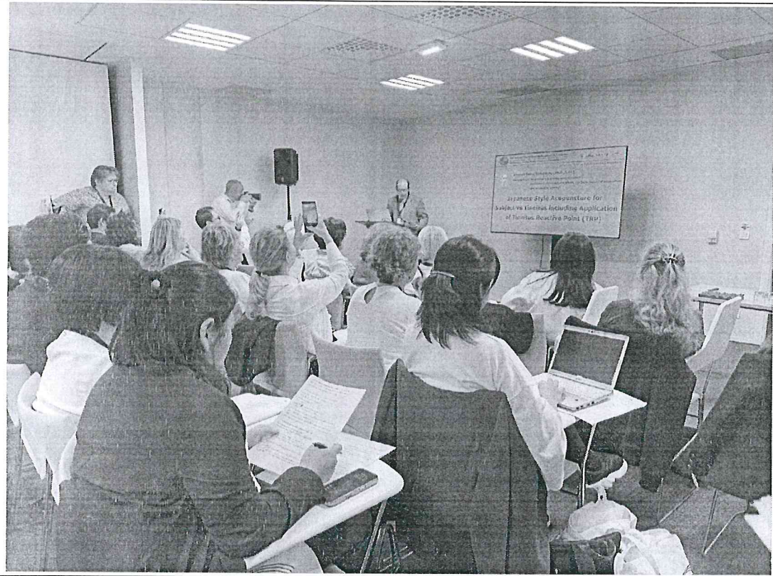
參與日本團隊的工作坊（針灸治療耳鳴）