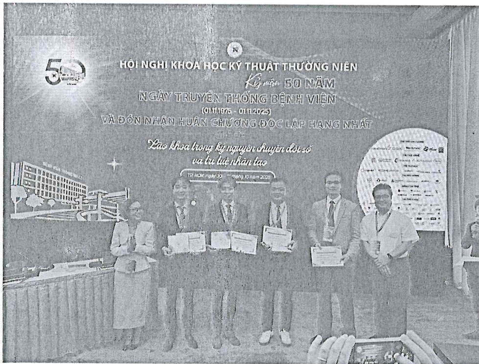
在研討會上與同一場次的日本講者獲頒參加感謝狀