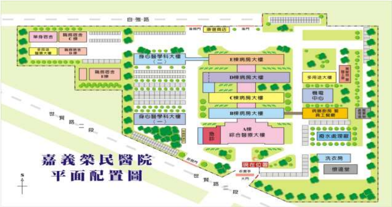
嘉義榮民醫院 平面配置圖