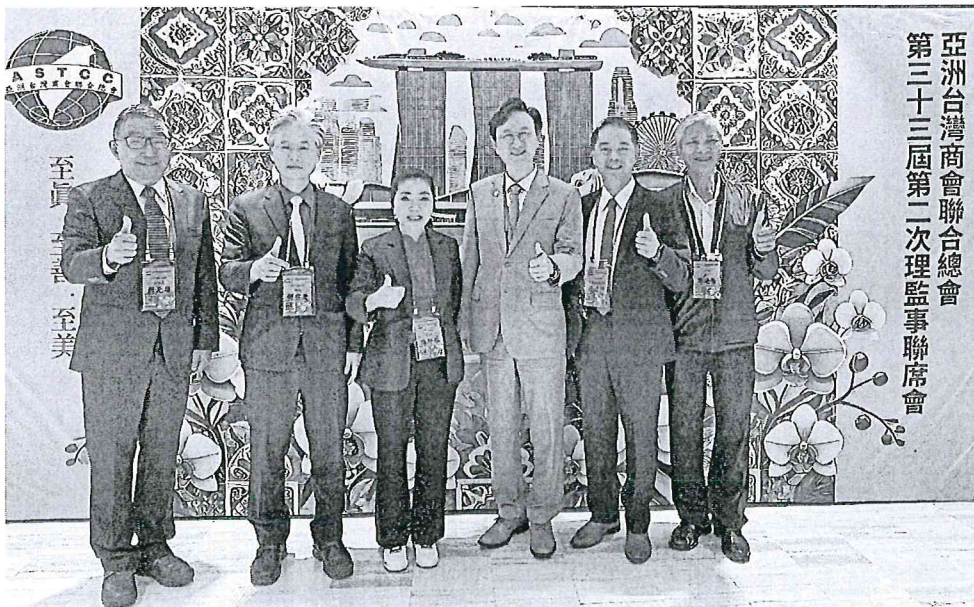
臺中榮總代表團於健康講座結束後，與駐新加坡彭振源大使進行交流討論並合影。