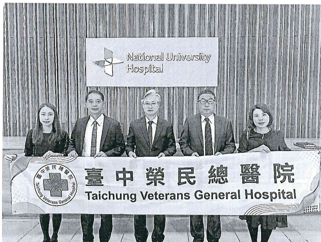
臺中榮總代表團至國立新加坡大學醫院 ( National University Hospital ) 進行參訪交流。