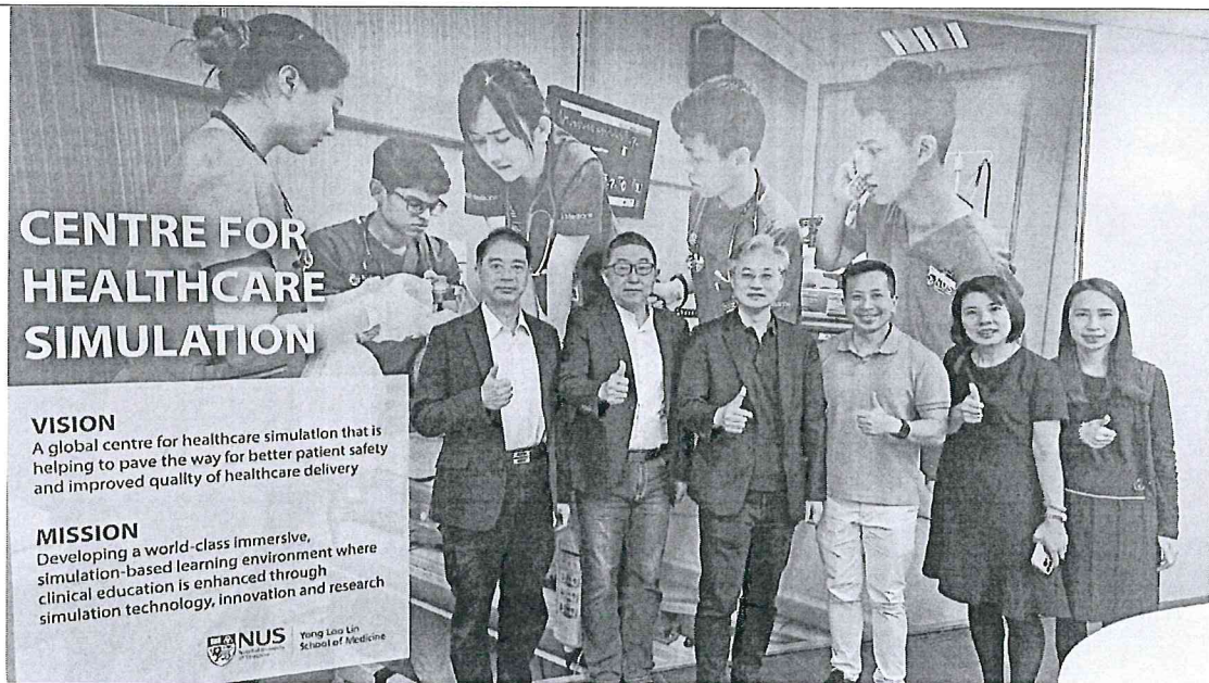
臺中榮總代表團至新加坡國立大學醫學院( Yong Loo Lin School of Medicine )模擬教室進行參訪。