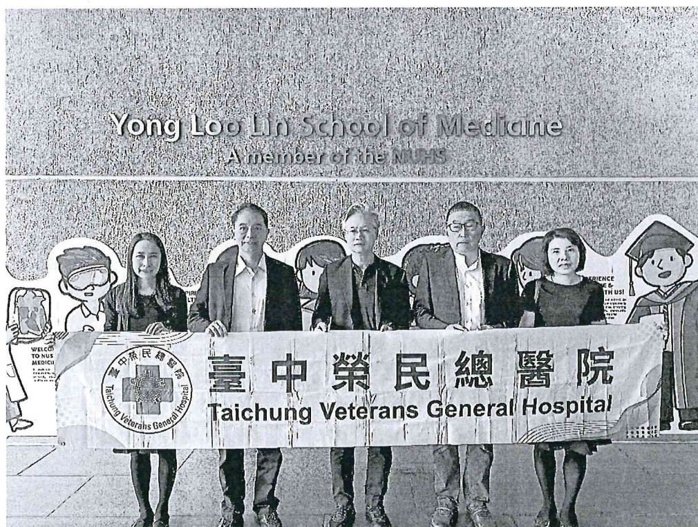
臺中榮總代表團至新加坡國立大學醫學院 (Yong Loo Lin School of Medicine) 進行參訪交流進行參訪交流。