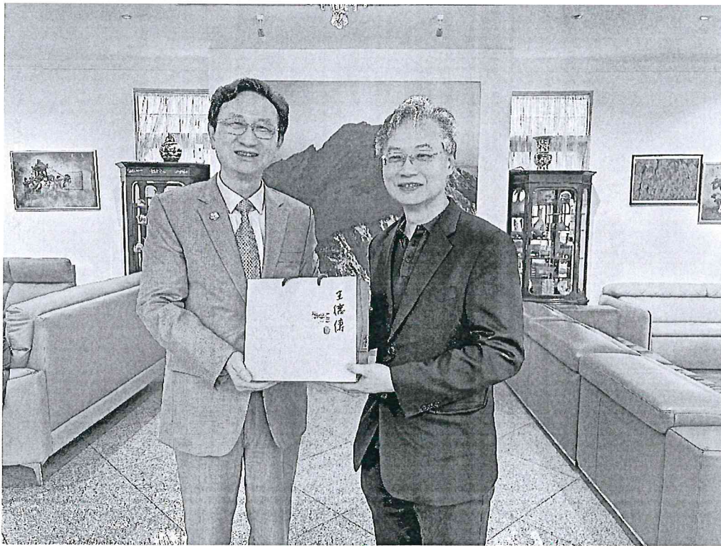
臺中榮總代表團至駐新加坡童振源大使官邸進行午宴交流。