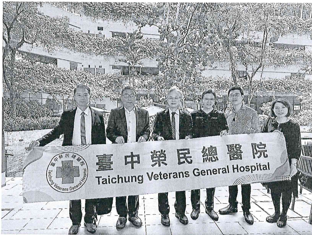
臺中榮總代表團至邱德拔醫院 ( Khoo Teck Puat Hospital ) 進行參訪交流。