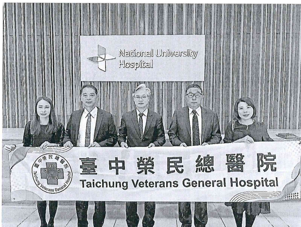
臺中榮總代表團至國立新加坡大學醫院（National University Hospital）進行參訪交流。