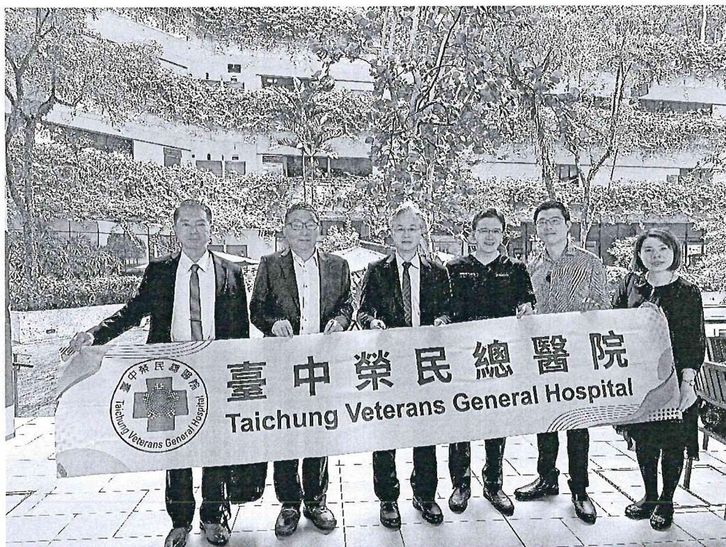
臺中榮總代表團至邱德拔醫院（Koo Teck Puat Hospital）進行參訪交流。