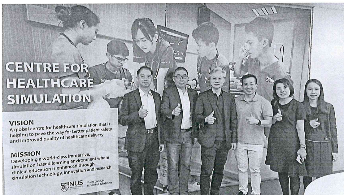
臺中榮總代表團至新加坡國立大學醫學院( Yong Loo Lin School of Medicine )模擬教室進行參訪。