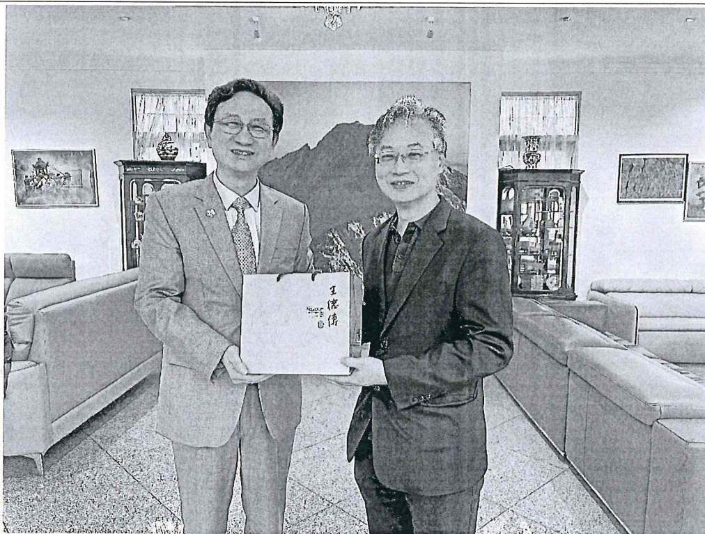
臺中榮總代表團至駐新加坡童振源大使官邸進行午宴交流。