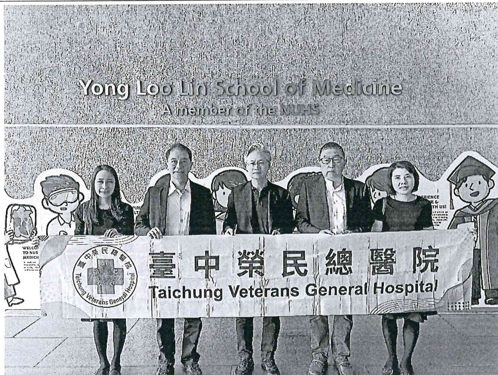
臺中榮總代表團至新加坡國立大學醫學院( Yong Loo Lin School of Medicine )進行參訪交流進行參訪交流。