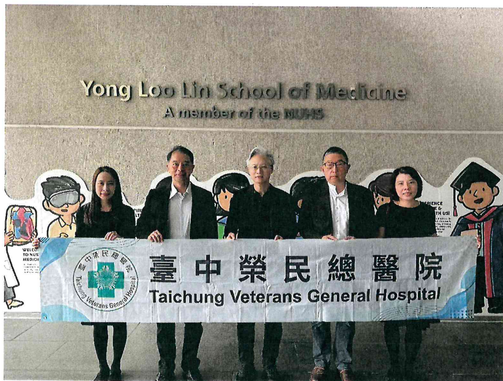
臺中榮總代表團至新加坡國立大學醫學院( Yong Loo Lin School of Medicine )進行參訪交流進行參訪交流。