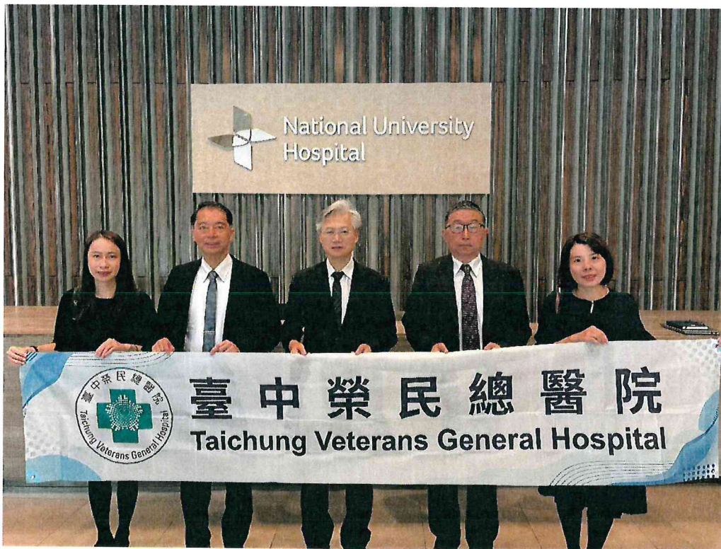
臺中榮總代表團至國立新加坡大學醫院（National University Hospital）進行參訪交流。