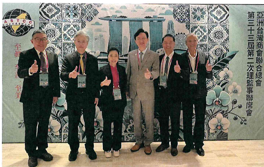
臺中榮總代表團於健康講座結束後，與駐新加坡童振源大使進行交流討論並合影。