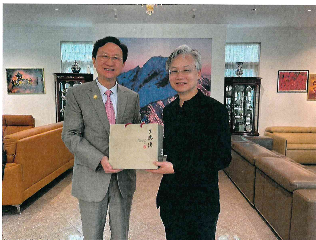
臺中榮總代表團至駐新加坡童振源大使官邸進行午宴交流。