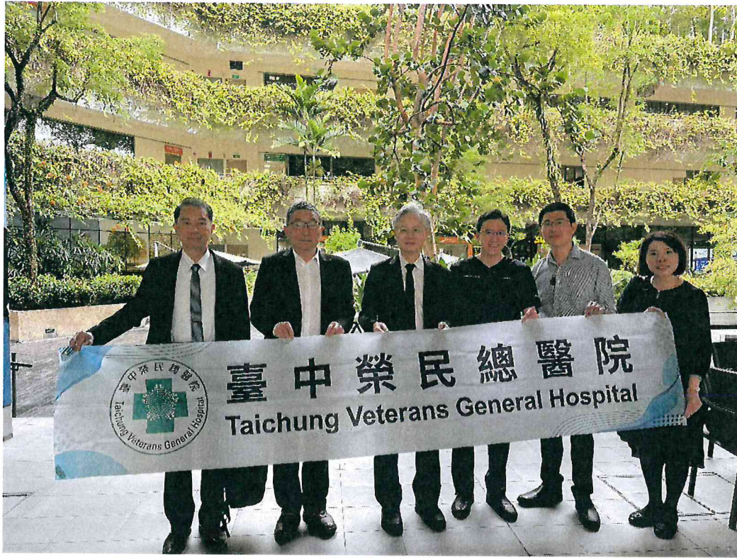
臺中榮總代表團至邱德拔醫院（Khoo Teck Puat Hospital）進行參訪交流。