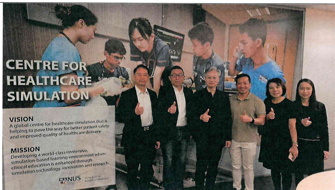
臺中榮總代表團至新加坡國立大學醫學院( Yong Loo Lin School of Medicine )模擬教室進行參訪。