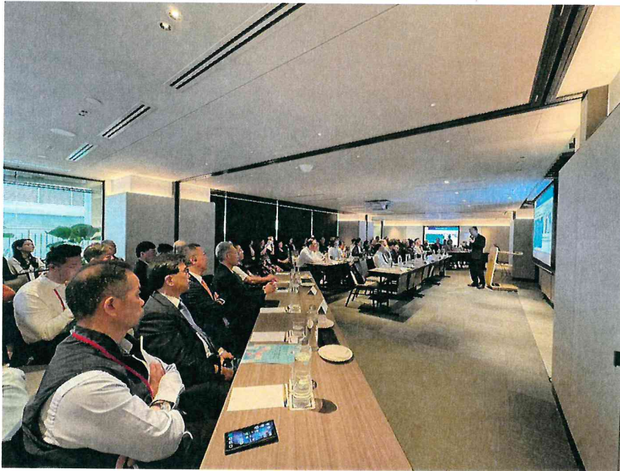
臺中榮總新加坡健康講座吸引逾百名僑台商參與，獲得熱烈迴響。