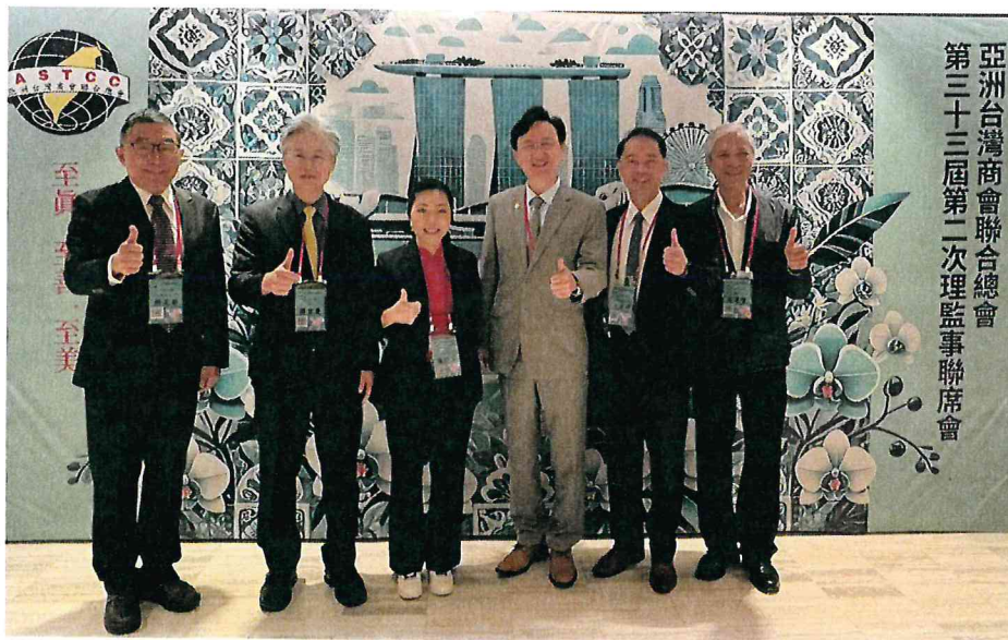
臺中榮總代表團於健康講座結束後，與駐新加坡童振源大使進行交流討論並合影。