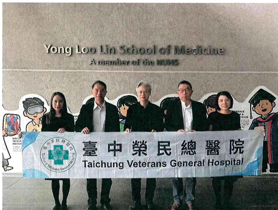
臺中榮總代表團至新加坡國立大學醫學院(Yong Loo Lin School of Medicine)進行參訪交流進行參訪交流。