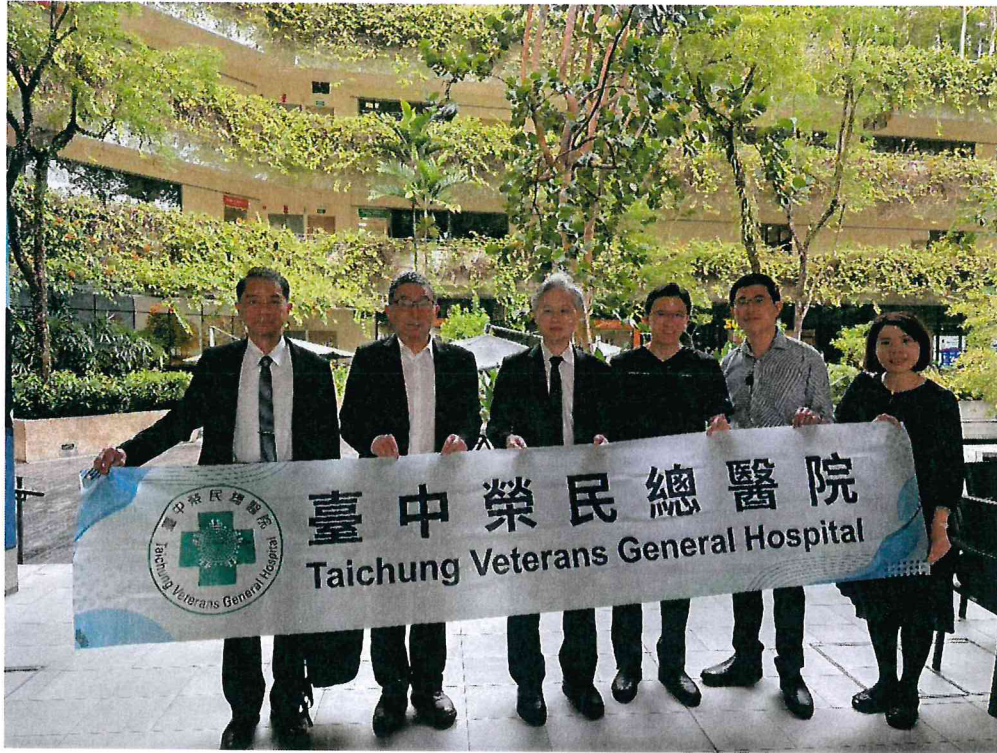
臺中榮總代表團至邱德拔醫院 ( Khoo Teck Puat Hospital ) 進行參訪交流。