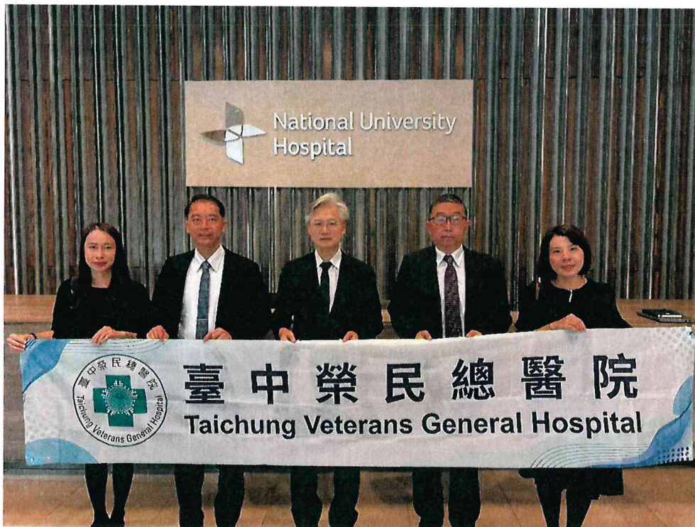
臺中榮總代表團至國立新加坡大學醫院 ( National University Hospital ) 進行參訪交流。