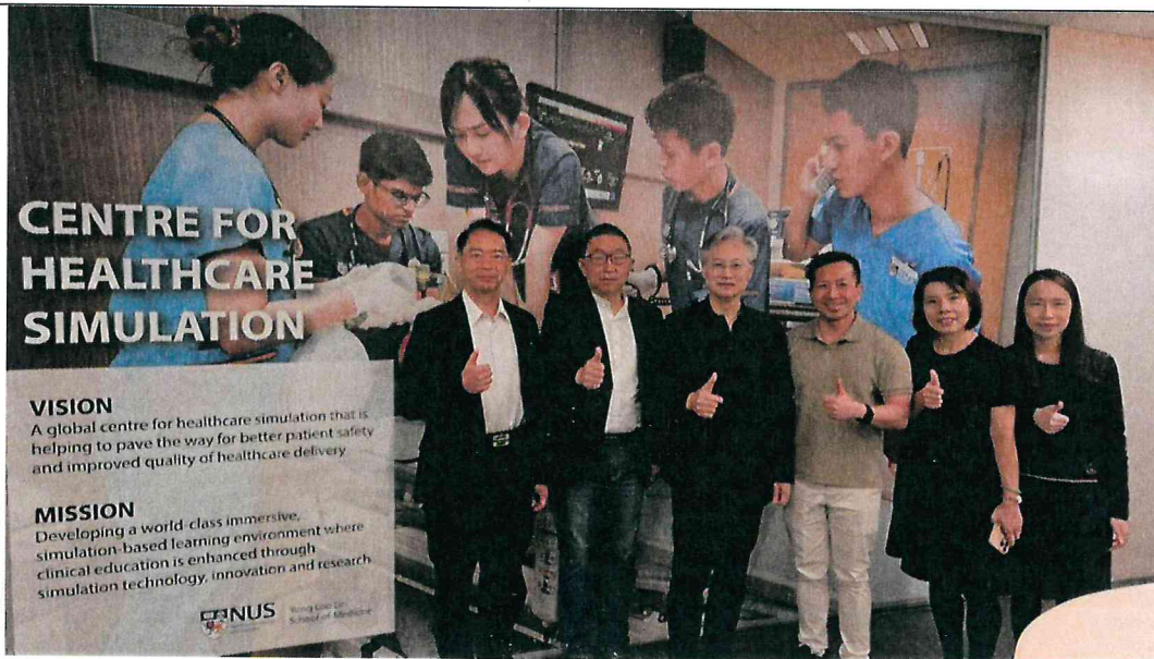
臺中榮總代表團至新加坡國立大學醫學院( Yong Loo Lin School of Medicine )模擬教室進行參訪。