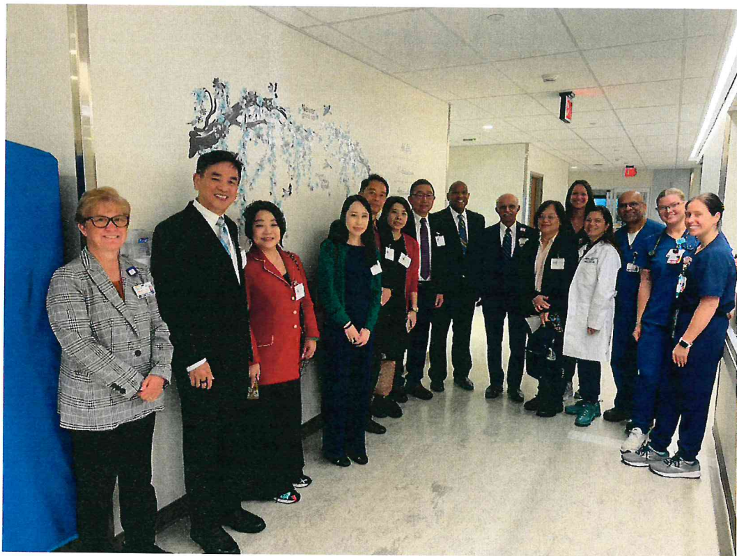
本院代表團至 Newark Beth Israel Medical Center 進行參訪交流