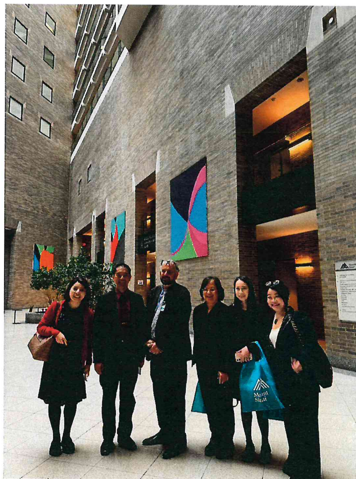
本院代表團至 The Mount Sinai Hospital 進行參訪交流