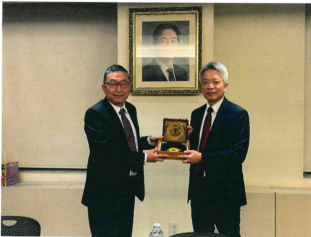
本院代表團至駐紐約台北經濟文化辦事處拜會李志強大使