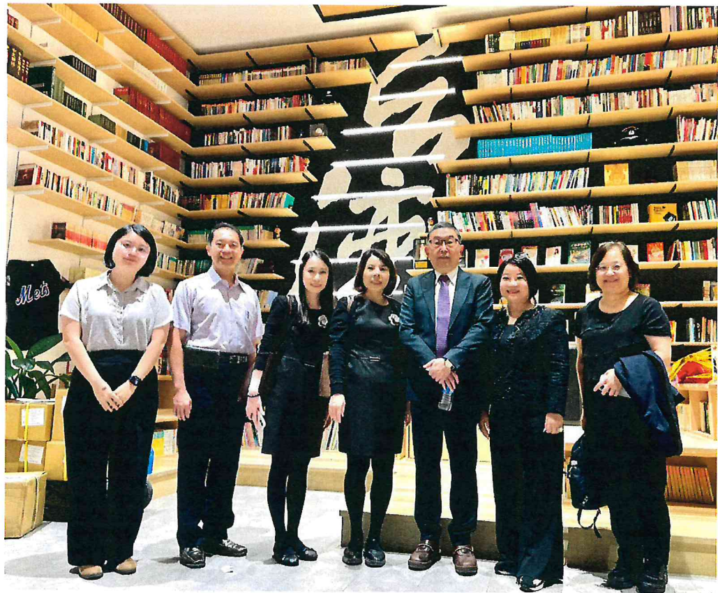
本院代表團至紐約華僑文教服務中心參訪