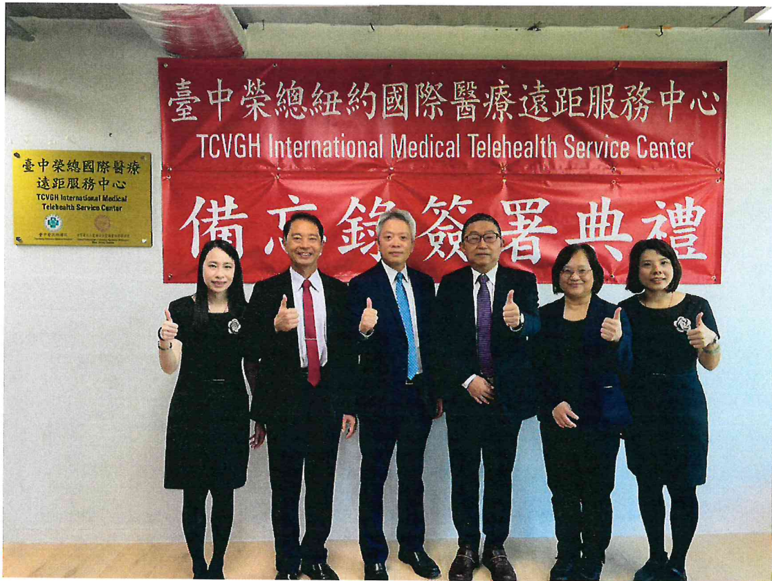
合作備忘錄簽署儀式暨臺中榮總美東「國際醫療遠距服務中心」揭牌儀式