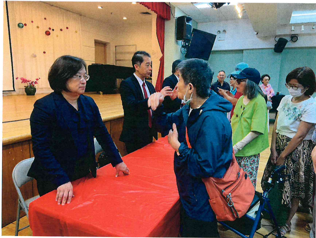
僑胞健康講座現場反應熱烈，僑胞踴躍提問與互動