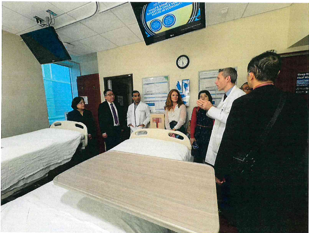
本院代表團至 The North Shore University Hospital 進行參訪交流