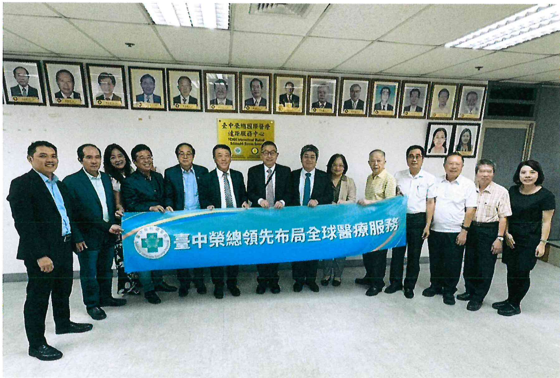
114年4月12日於菲律賓台商總會進行臺中榮總國際醫療遠距服務中心揭牌儀式(二)