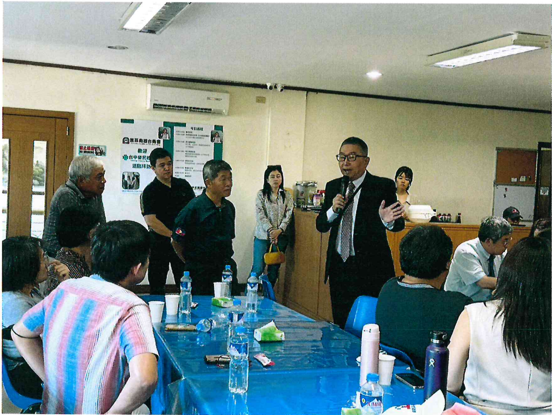
114年4月12日於旅菲南線台商會進行健康講座獲得熱烈迴響