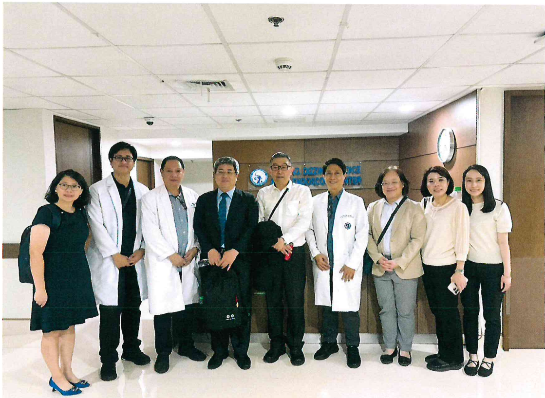
114 年 4 月 11 日於 Manila Doctors Hospital 參訪耳鼻喉頭頸部