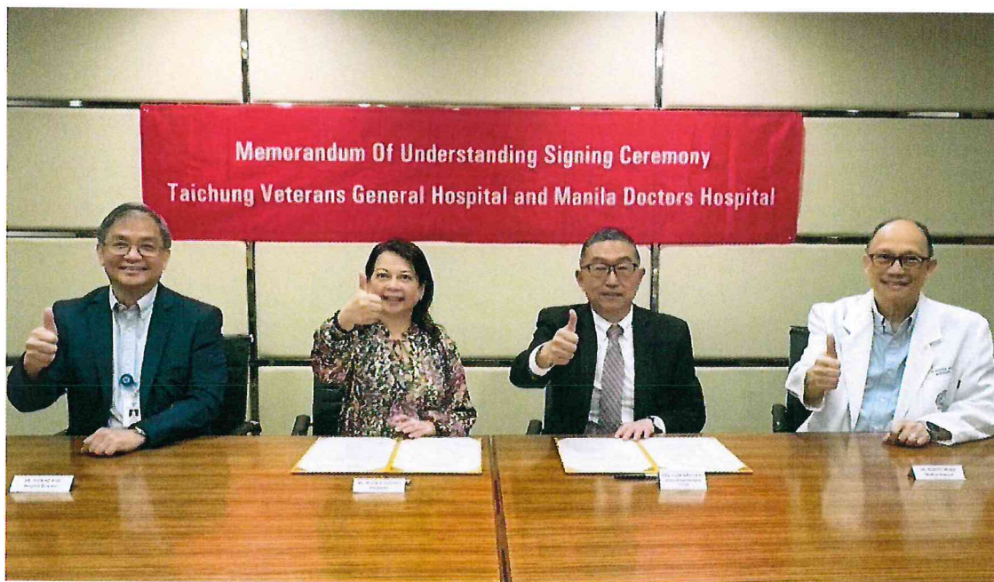
114 年 4 月 11 日於菲律賓 Manila Doctors Hospital 簽署合作備忘錄