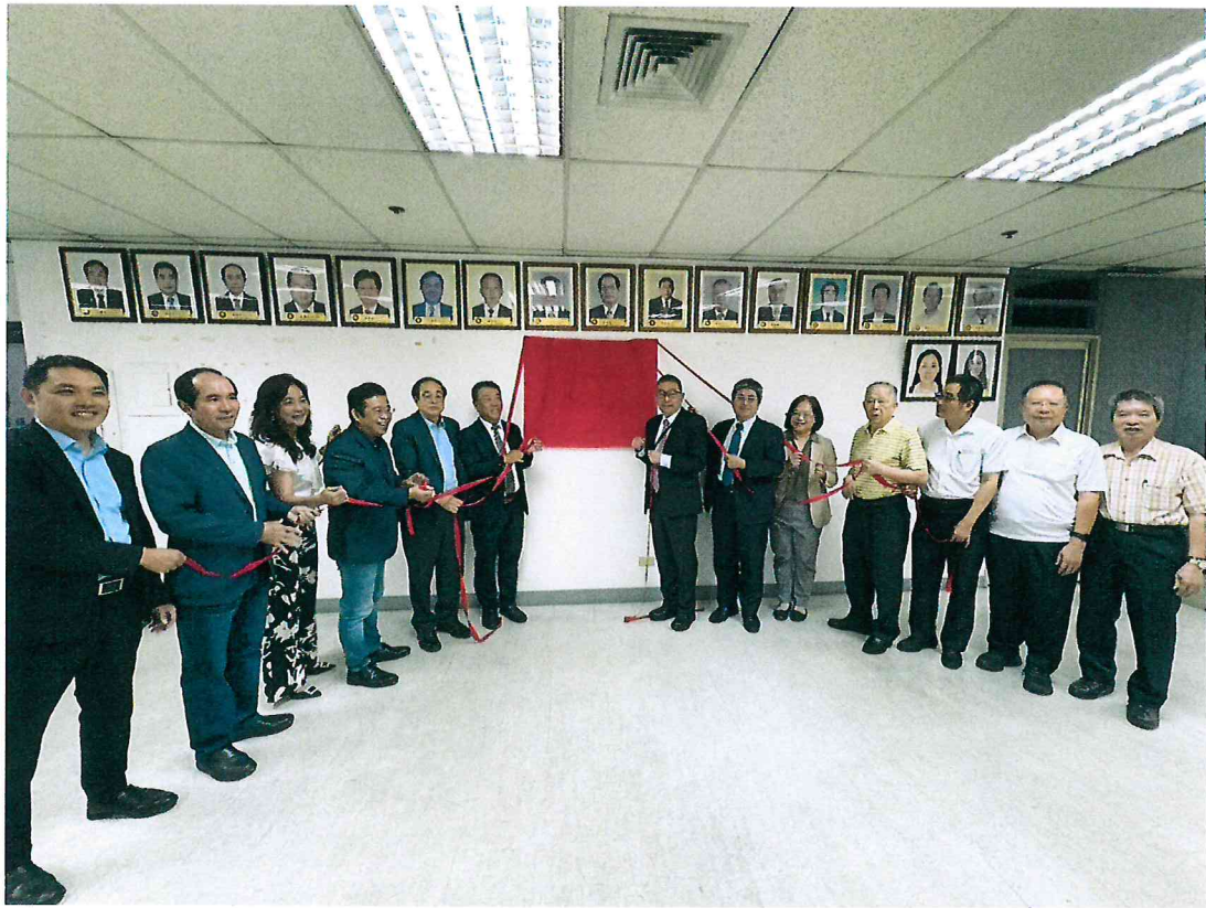
114年4月12日於菲律賓台商總會進行臺中榮總國際醫療遠距服務中心揭牌儀式(一)