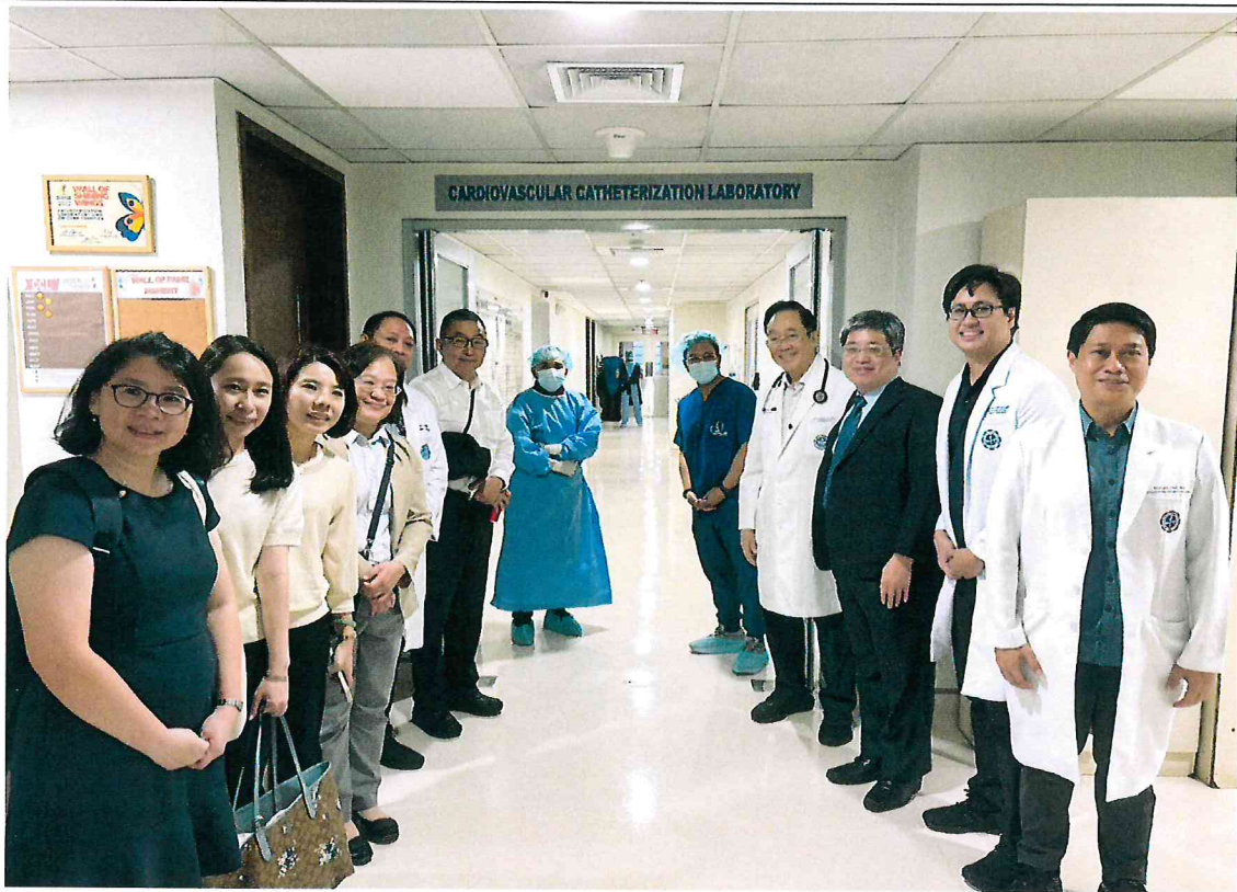
114 年 4 月 11 日於 Manila Doctors Hospital 參訪心臟血管中心