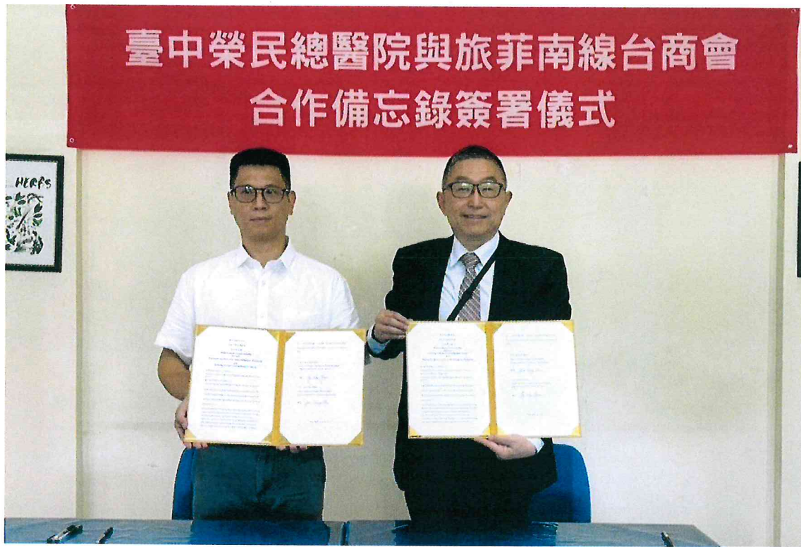
114年4月12日於旅菲南線台商會簽署合作備忘錄