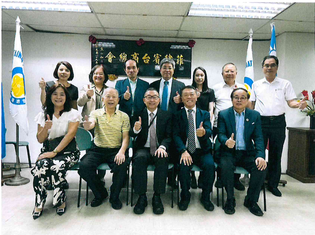
114年4月12日菲律賓台商總會之活動順利完成後與菲律賓台商總會幹部合影