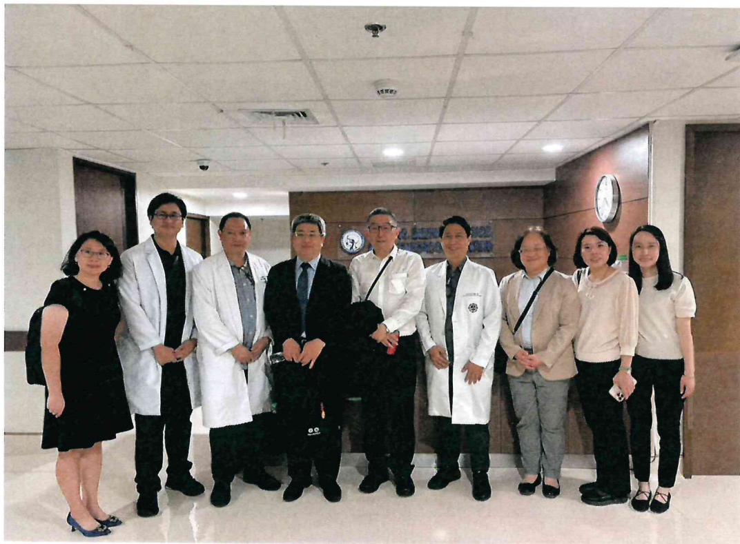
114年4月11日於 Manila Doctors Hospital 參訪耳鼻喉頭頸部