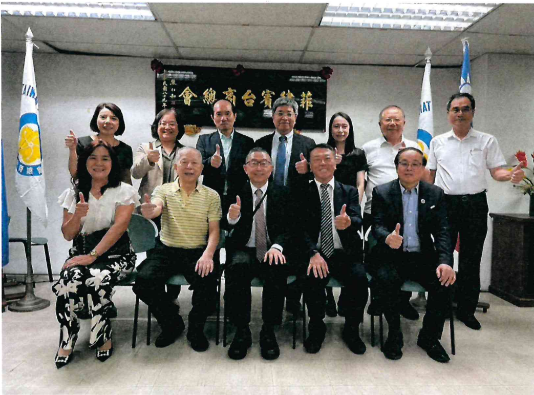
114年4月12日菲律賓台商總會之活動順利完成後與菲律賓台商總會幹部合影