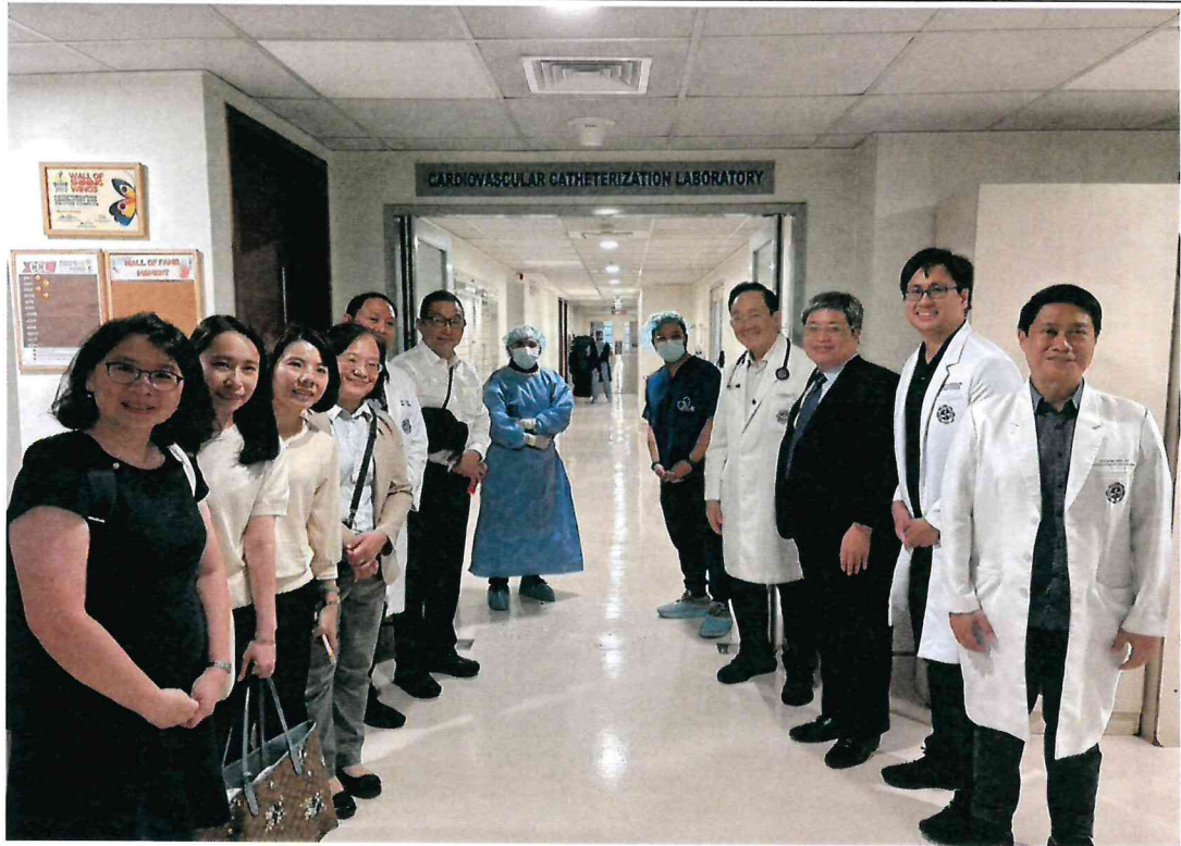
114年4月11日於 Manila Doctors Hospital 參訪心臟血管中心