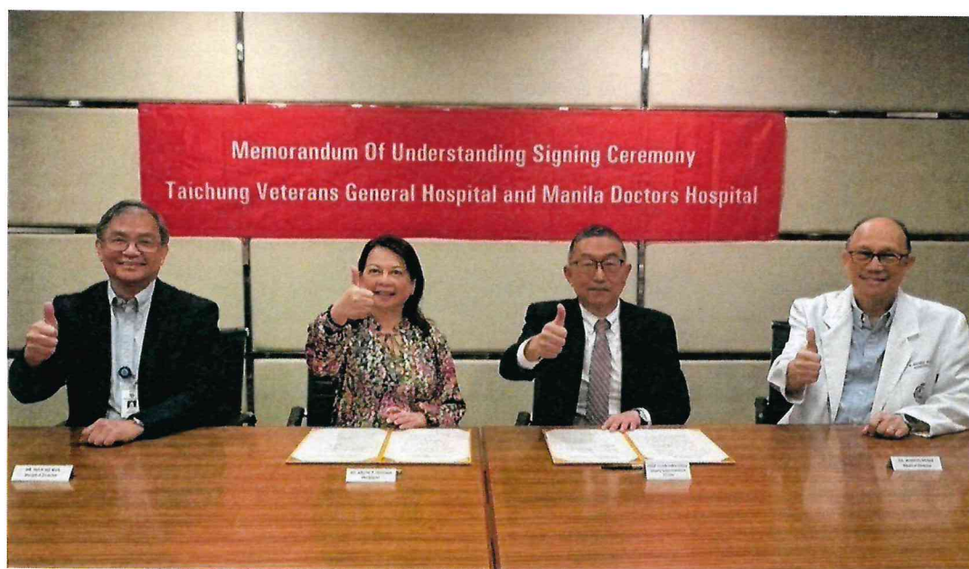
114 年 4 月 11 日於菲律賓 Manila Doctors Hospital 簽署合作備忘錄