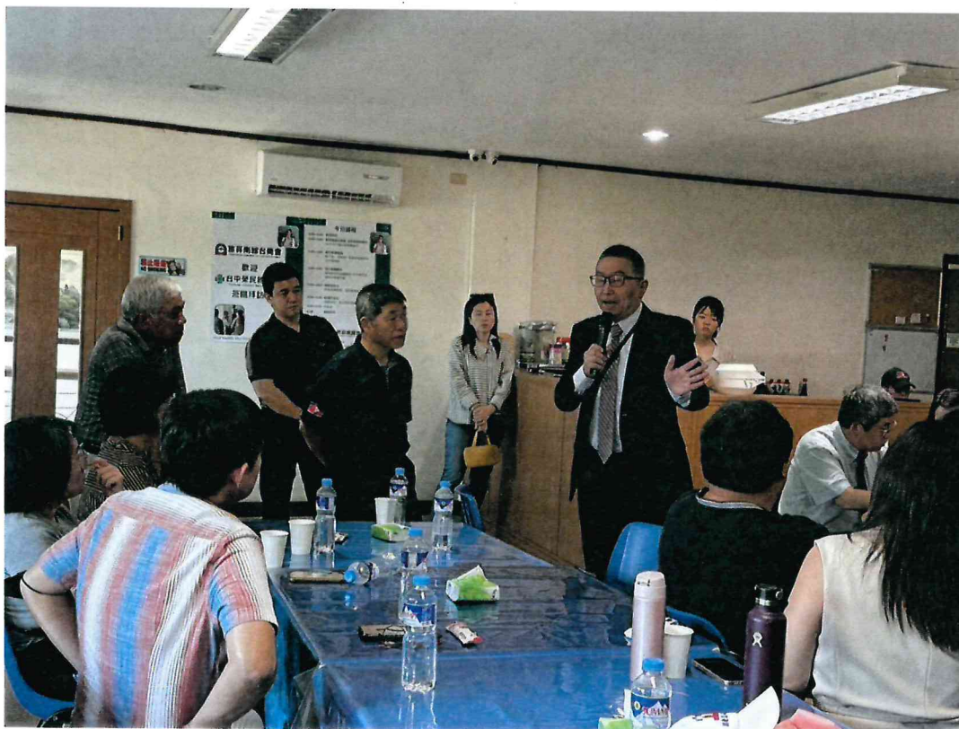
114年4月12日於旅菲南線台商會進行健康講座獲得熱烈迴響