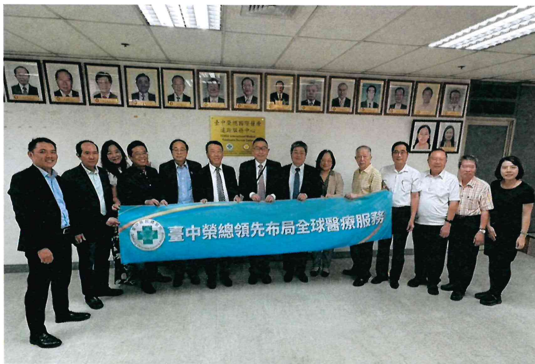
114年4月12日於菲律賓台商總會進行臺中榮總國際醫療遠距服務中心揭牌儀式(二)