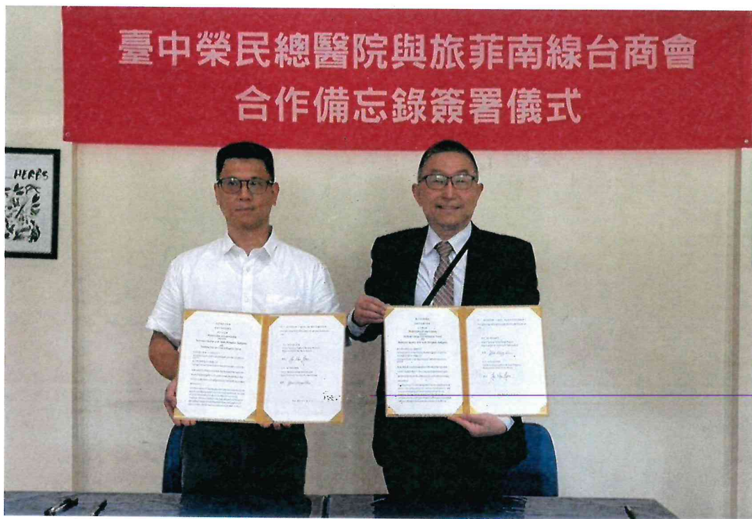
114年4月12日於旅菲南線台商會簽署合作備忘錄