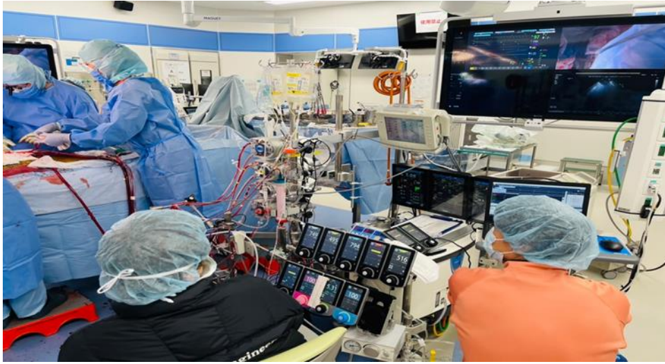
CE 在 CPB 管理上採取兩人合作模式