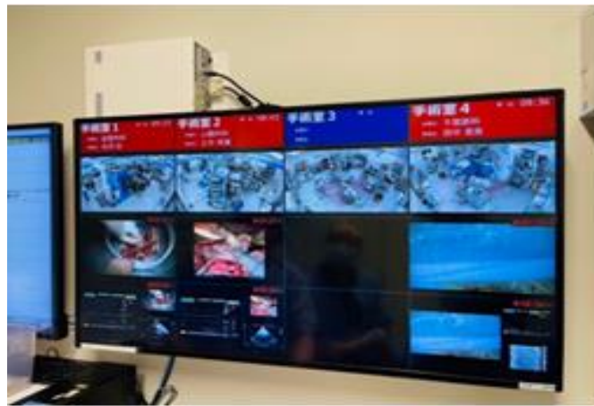
手術室護理站所有房間開刀房內畫面（含生理監視器）