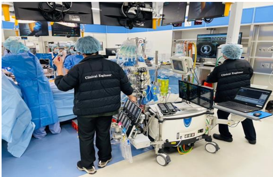
準備將 CPB 機器湊上手術台，準備與病患連接