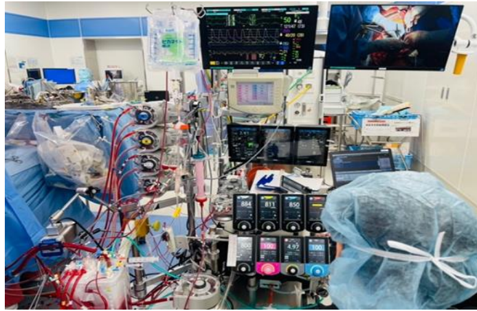
CE 視角：手術影像、即時生理監視器畫面