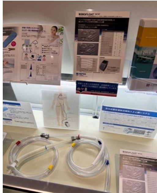
BIOFLOAT VAD 管路