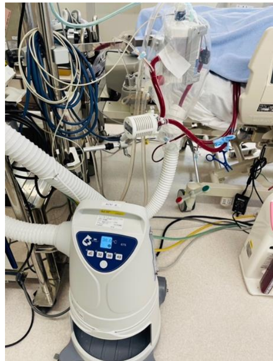
人工肺溫毯機加熱減少人工肺內外溫差