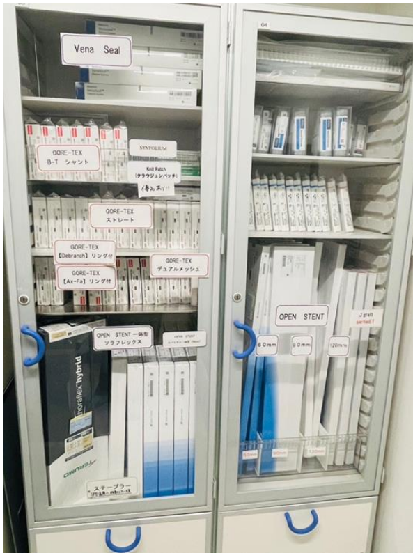
血管及止血膠保存櫃