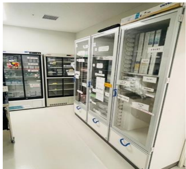
溫控植入式耗材保存櫃