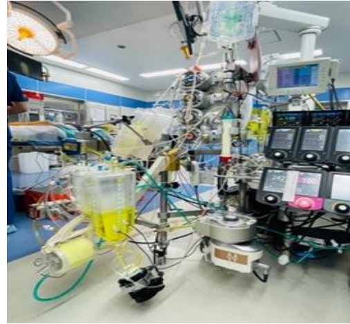
添加 Vit C、B1 完成 CPB 準備