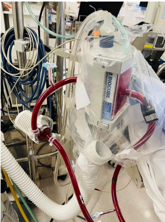
BIOFLOAT-NCVC 及 BIOCUBE