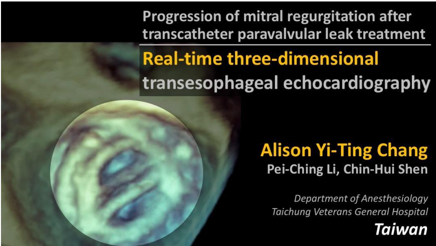
圖 2 發表之海報論文 內容