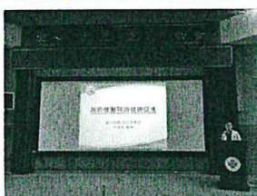
Our regular updated lesson of HPH