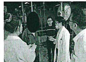
Our onsite health service visit