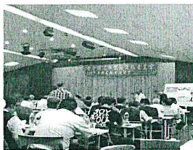
Tobacco-free lessons to taxi drivers