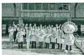
Our superintendent swear to lead the hospital to join health promotion