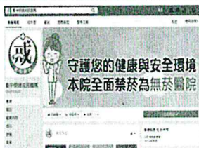
Our FB fanpage for tobacco cessation