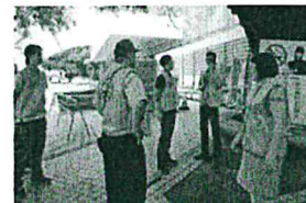
Our tobacco-free patrol team is working everyday