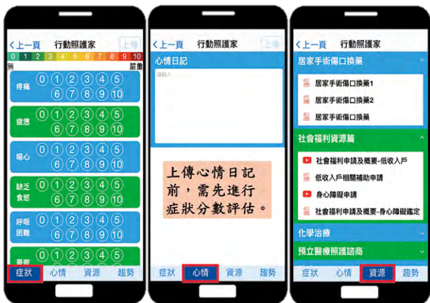
▲ 圖 4，評估畫面使用簡介