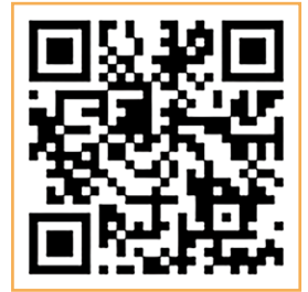
▲ 圖 2，「家人清單」綁定教學影片

民總醫院行動掛號 App」(圖 1)的方法，簡單又快速，除了可即時查詢醫生門診表、掛號、即時掌握看診進度，在「家人清單」(圖 2)綁定個人資訊，即可查詢檢查報告、處方用藥、個案管理衛教資訊(圖 3)等功能。