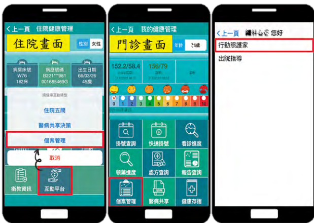
▲ 圖 3，「行動照護家」途徑與位置