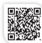
↑ 小光點畫廊粉絲團