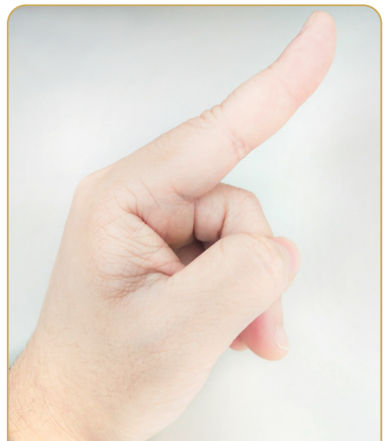
圖三：拇指按壓各指第二指節示意圖。

手部多休息、使用腕部護具，配合練習手功之精細動作，如拇指與各指輪流畫圈、拇指壓各指第二指節（圖三）、手握圓珠筆或鉛筆並在手中滾動、撿放牙籤等，促進功能恢復。🏥