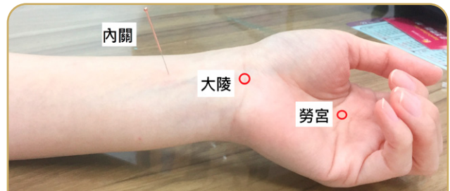
圖二：常用治療腕隧道症候群穴位。

雷射針灸，常用穴位如勞宮、內關、大陵等（圖二），再配合傷科手法按摩，可有效止痛及消除麻木感。