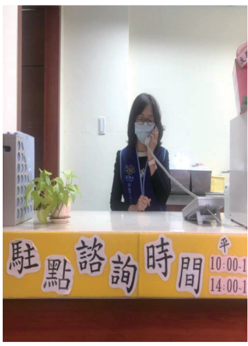
▲門診藥局旁長照志工諮詢站