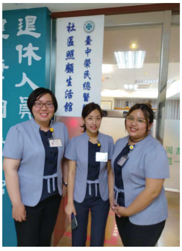
▲急診地下二樓社區照顧生活館