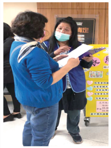
▲長照志工走動式服務站