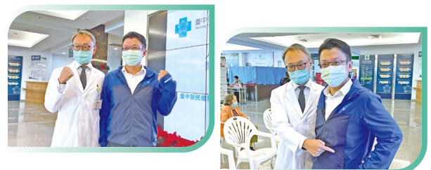
▲ 蘇先生於記者會現身說明術後恢復情況良好

回到醫者仁心，外科醫師的初衷，便是將更先進的醫療，透過教育的廣度，分享給更多病患與醫師，以更高品質的醫療成果，提供病患更快更好的身體恢復，重現在病患臉上的笑容，便是外科醫師最寬慰的動力。🏥