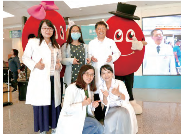
腎臟科 萬人護腎記者會

曾有位糖尿病人腎功能惡化由肌酐酸 1.0mg/dL 變成 2.4 mg/dL、蛋白尿激增求診，因病情變化迅速，建議腎臟切片後診斷為多發性骨髓瘤，轉介血液科經適切藥物治療，回復原來腎功能！更成功避免