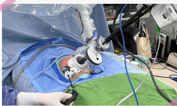
▲ 單孔達文西手術系統具有顯著優勢，手術視野可放大 10 至 15 倍，影像更加清晰，且多關節可彎曲的機械手臂特別適合在狹小空間內操作，相較於傳統腹腔鏡更加靈活。

低組織損傷、加速術後恢復，更重要的是單一傷口可隱藏在肚臍內，幾乎不留疤痕，為兒童患者帶來「小傷口、大希望」的治療新選擇。