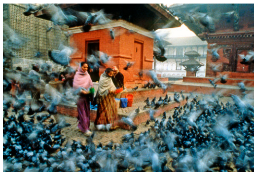
《飛舞》加德滿都 尼泊爾