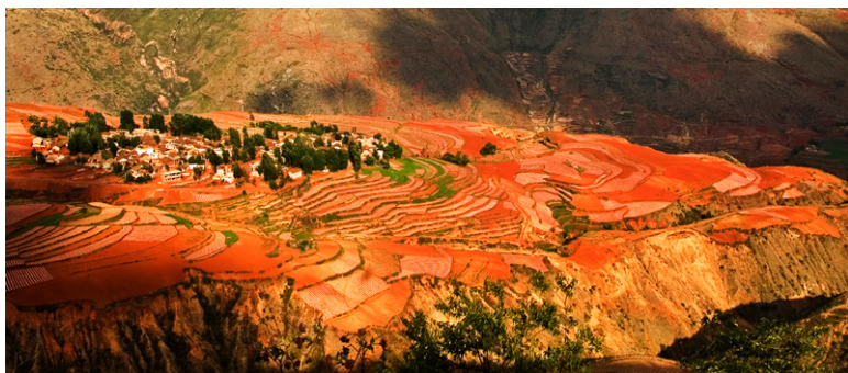
《落霞溝 東川紅土地》雲南 中國