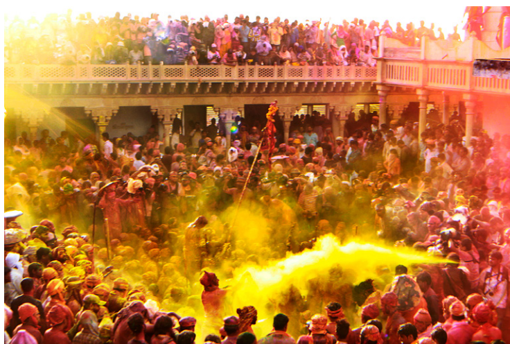
《灑紅節》巴爾賽納 印度