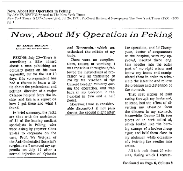
▲ 1971 年美國《紐約時報》記者雷斯頓 (James Reston) 對針灸治療的報導 (Now, About Mt Operation in Peking)