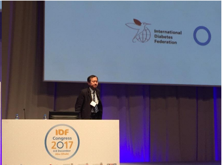
擔任大會專題演講主持人