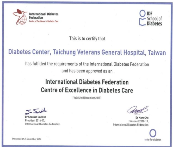
世界糖尿病聯盟頒發糖尿病卓越照護中心獎