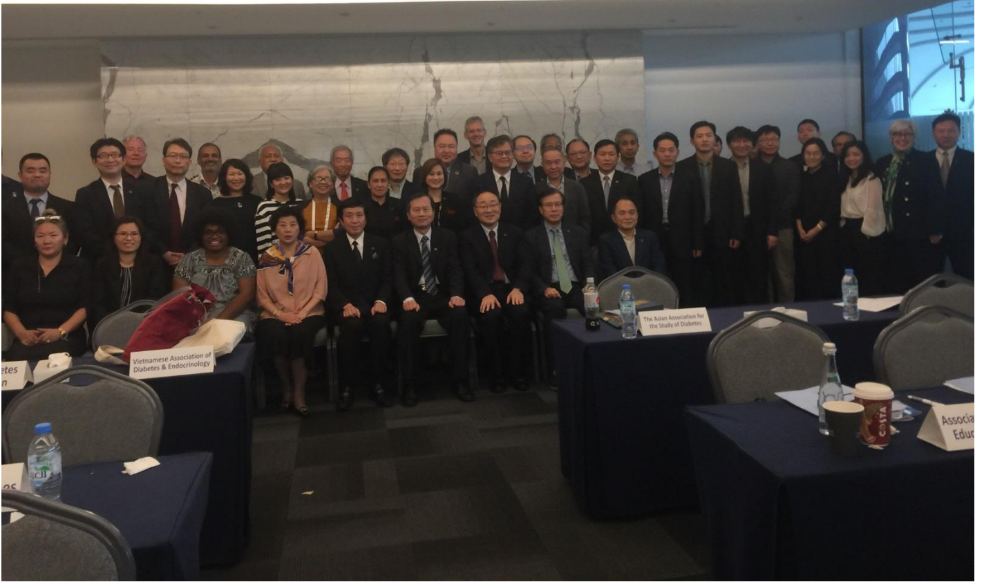
擔任西太平洋區糖尿病聯盟主席，召開會員國代表大會