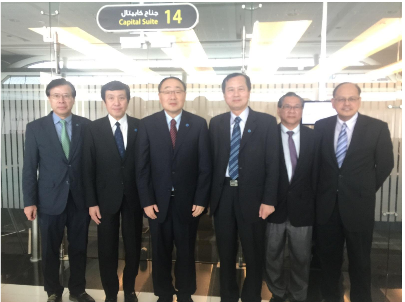
擔任西太平洋區糖尿病聯盟主席，召開執行委員會