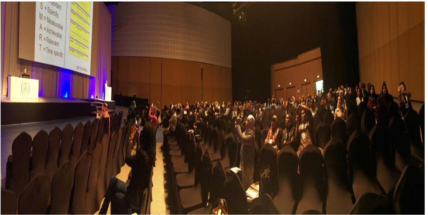
擔任大會專題演講主持人