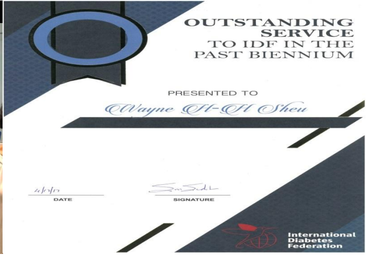
世界糖尿病聯盟頒發個人貢獻獎