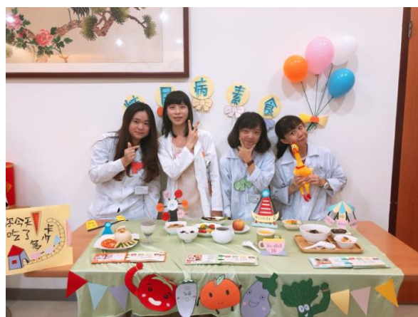
第二組學生發表『糖尿病素食餐』