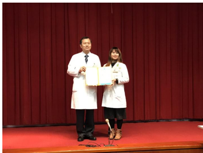
院務會議中院長頒獎