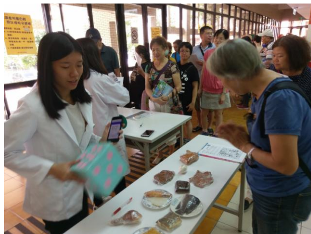
遊戲之一：蛋白質份量骰骰樂