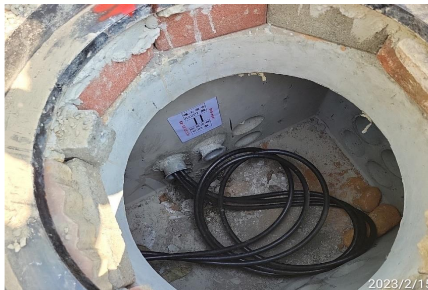
高壓管線佈線查驗