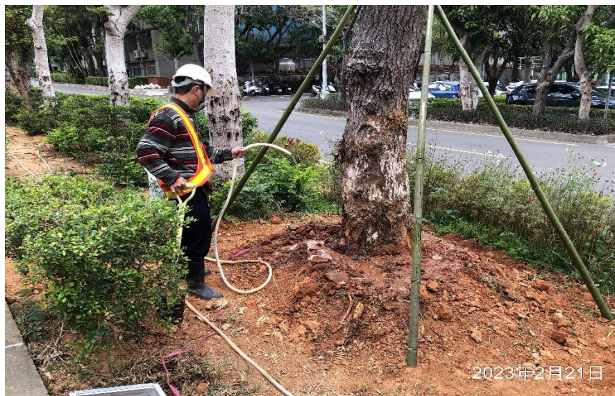
移植後施肥澆水養護