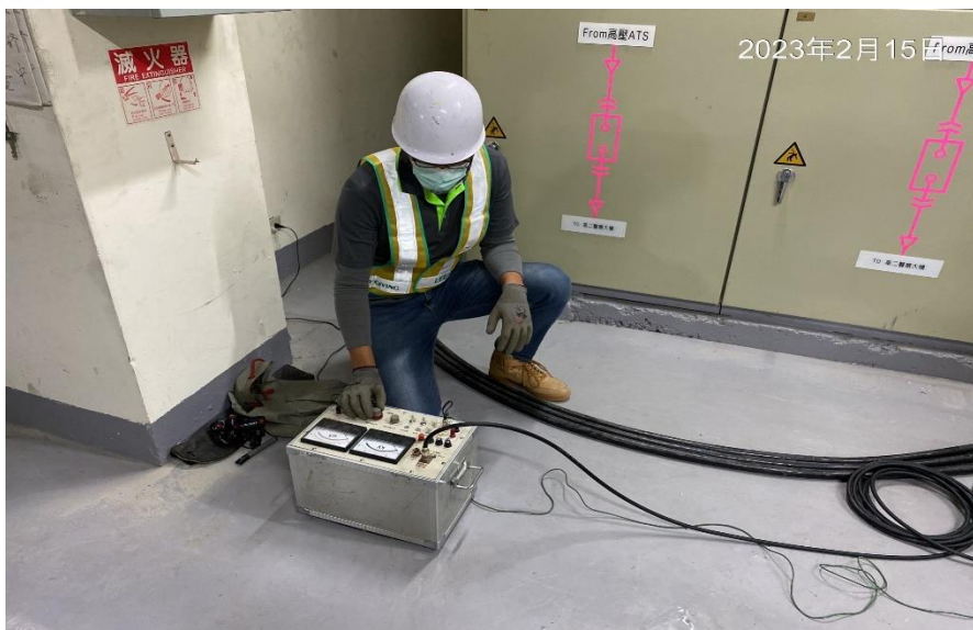
高壓管線絕緣電阻測試