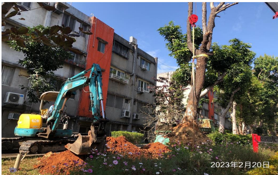
臨時廁所水電配管