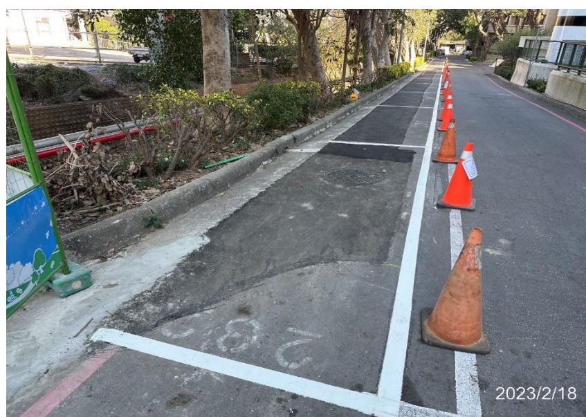
宿舍前車道停車格畫線