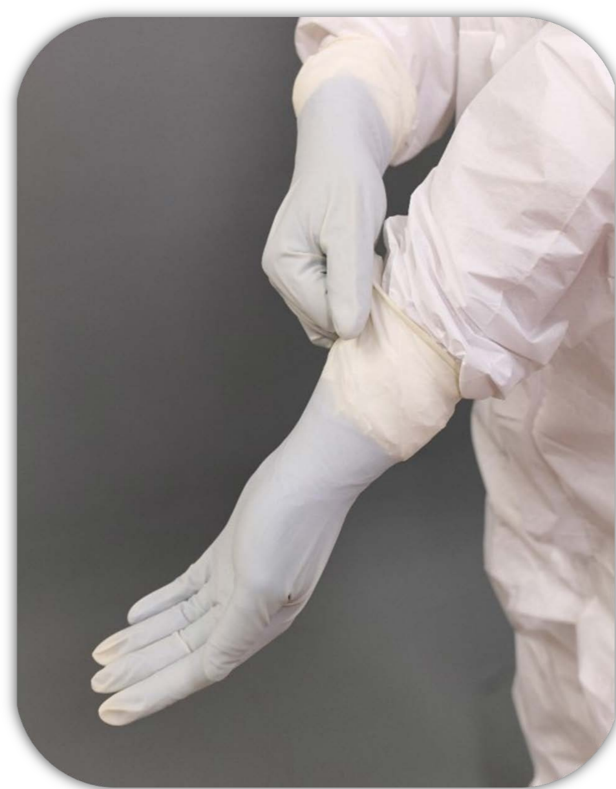
7 戴第二層手套 須包覆連身型防護衣袖口