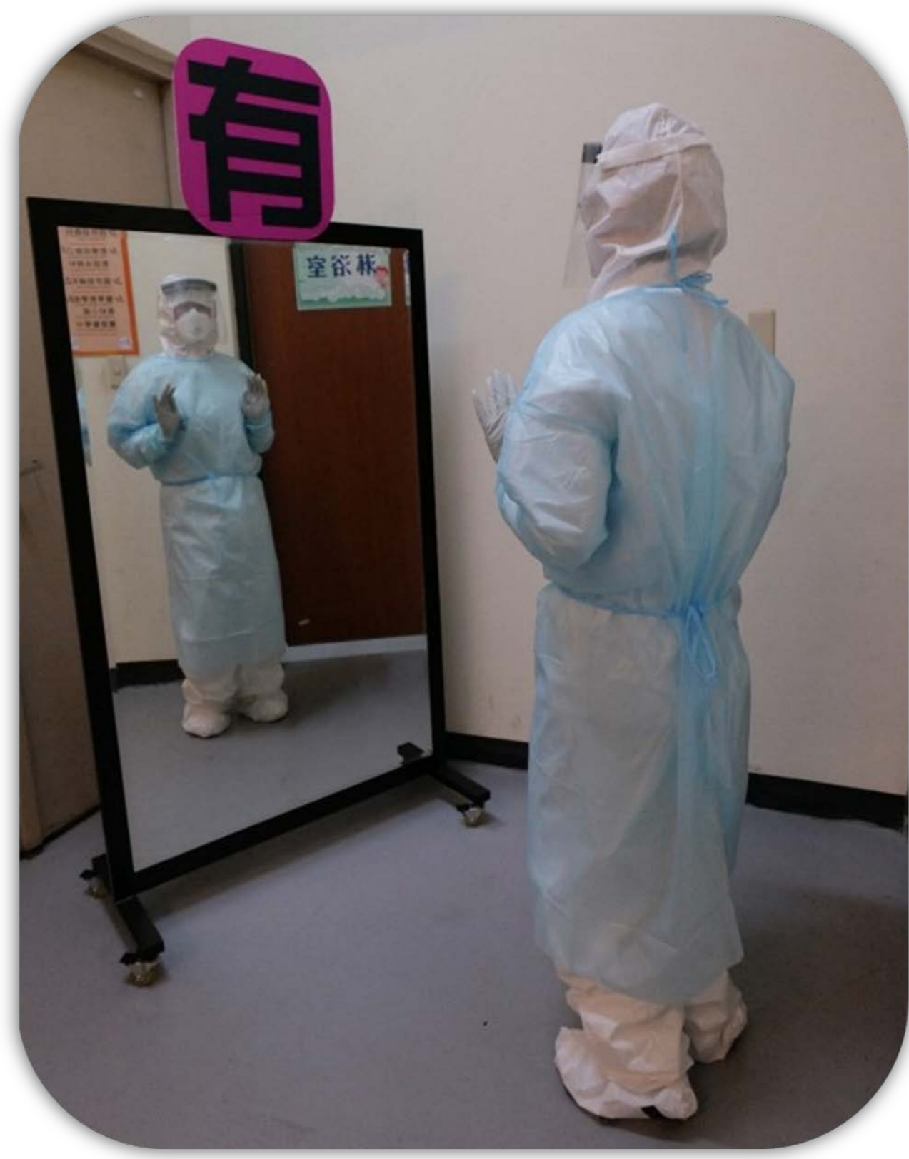
10 檢視裝備 確認穿戴完整