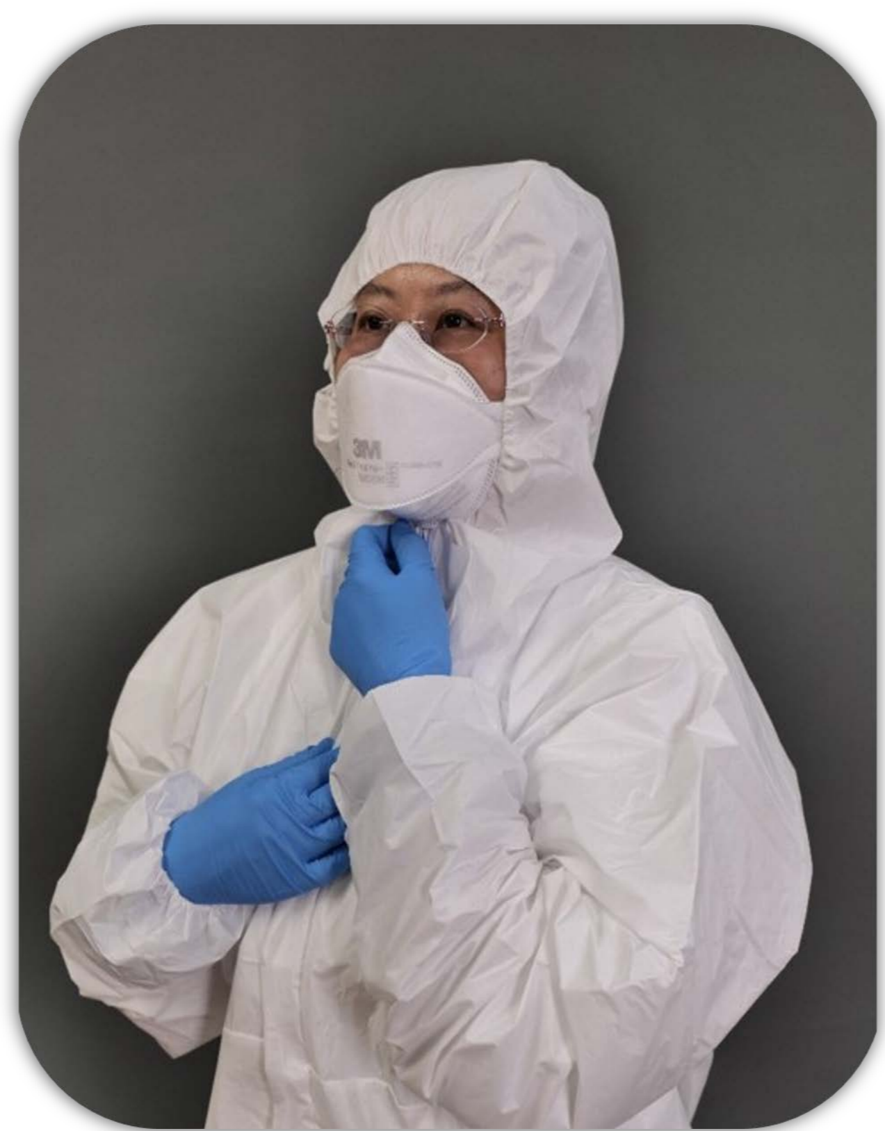
6 戴防水連身型 防護衣帽子

進行密合度測試 將鐵片沿鼻樑向下壓緊做漏氣測驗 將手置於口罩邊緣大口進行吸吐氣測試 注意有無漏氣情形