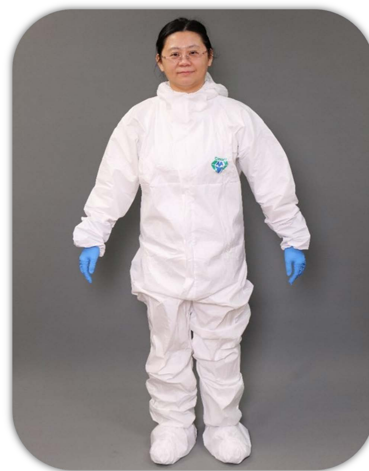
4 穿防水連身型 防護衣