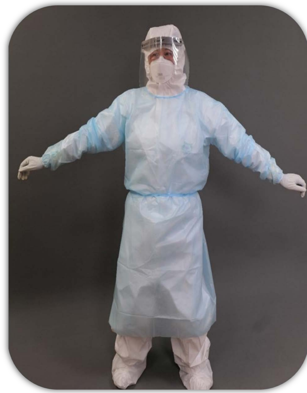
11 做伸展動作，確認裝備 仍完全包覆皮膚無暴露