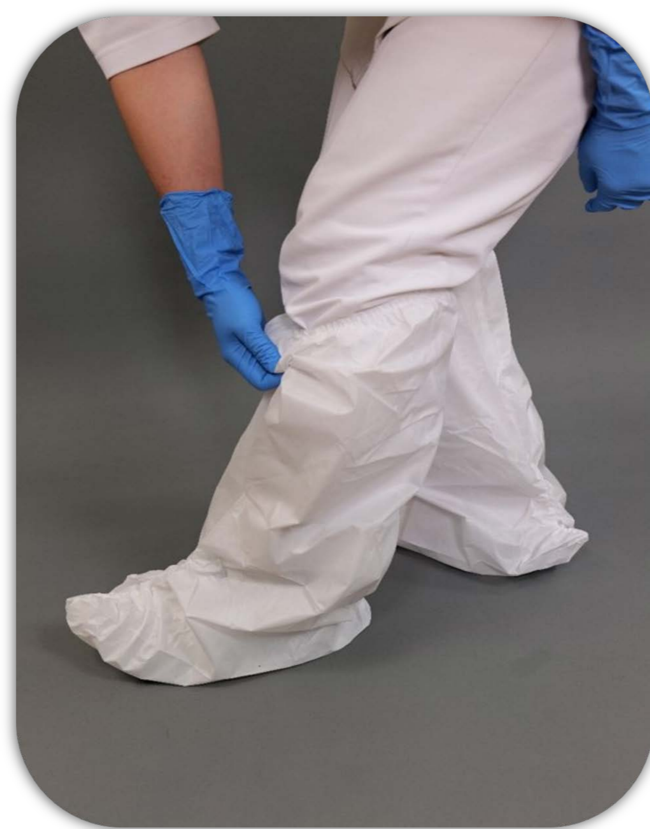
3 穿防水長筒鞋套 長筒鞋套有綁帶，將綁帶綁好 若物資缺乏將以短鞋套取代 (一體成型連身型防護衣則不需 再穿長筒鞋套)