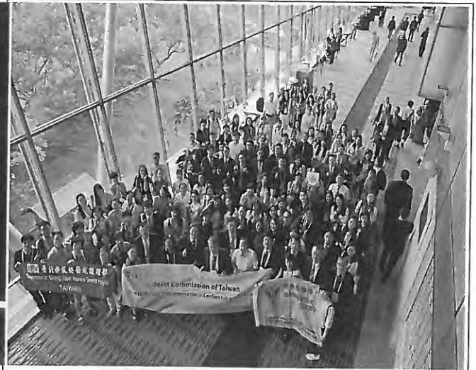
臺灣醫界代表全體大合照