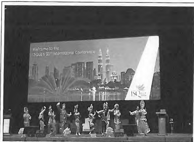
Opening Cultural Performance-文化舞蹈表演