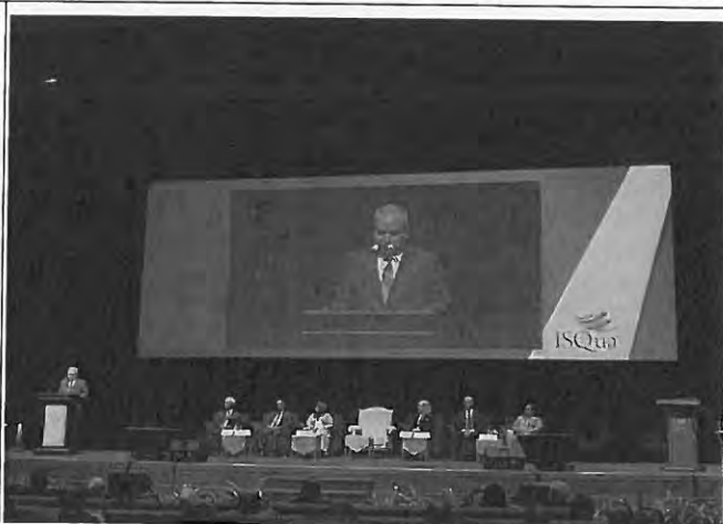
霹靂州蘇丹納茲林沙殿下蒞臨會場致詞