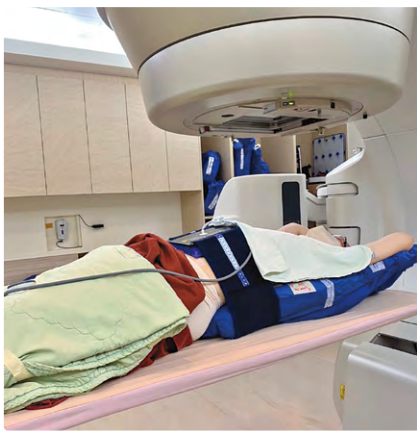
A. 腹部壓迫板限制呼吸幅度